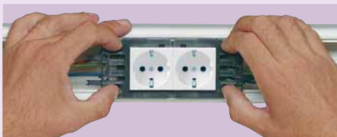
Монтаж розеток Mosaic в кабель-каналы DLP