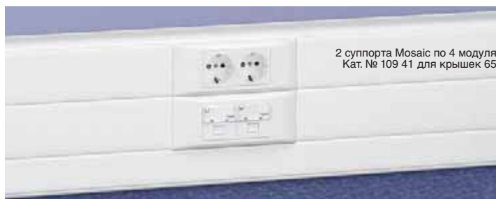
2 суппорта Mosaic по 4 модуля Кат. № 109 41 для крышек 85