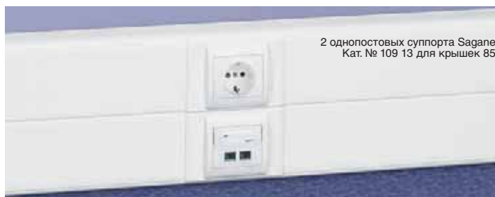
2 однопостовых суппорта Sagane Кат. № 109 13 для крышек 85