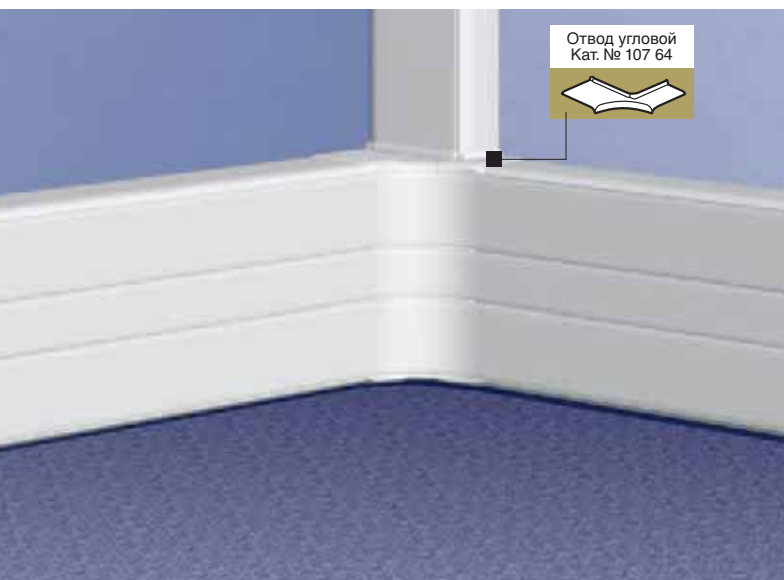
Отвод угловой Кат. № 107 64